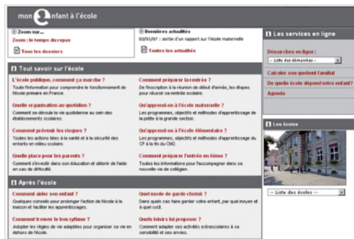
Exemple de page d'accueil de « mon enfant à l'école » intégrable sur le site d'une mairie.

« mon enfant à l'école » s'intègre en toute simplicité sur le site internet des communes, de façon transparente pour l'utilisateur. C'est un service « clé en main » pour la commune, qui peut ainsi offrir une visibilité égale à toutes les écoles de son territoire.